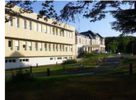
Etablissement BEL AIR