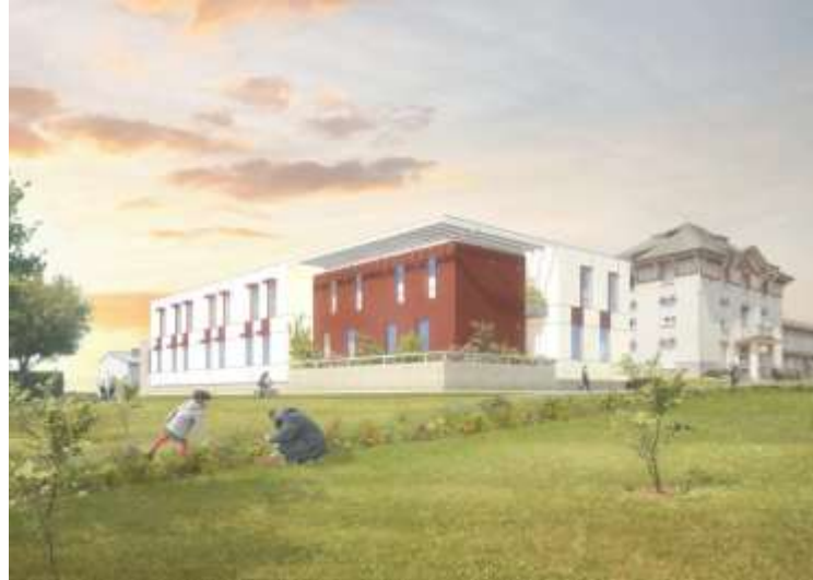
Centre Louis SEVESTRE