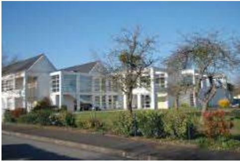
Maison de retraite Notre Dame des Eaux