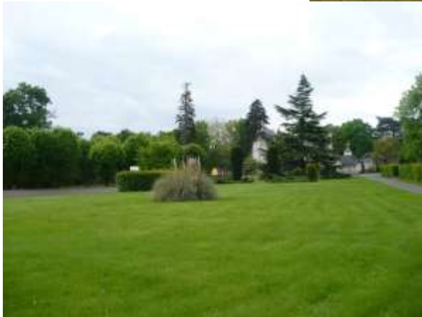
Institut Départemental de l'Enfance et de la Famille