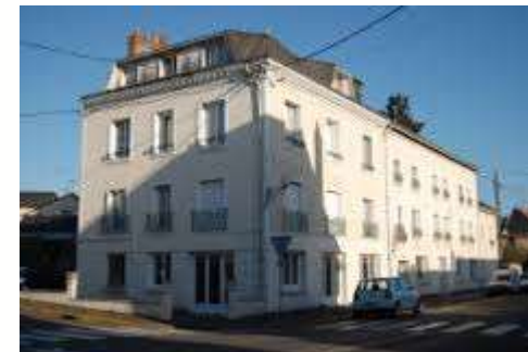
Résidence la Choisille