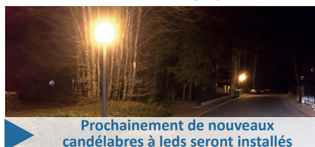
Prochainement de nouveaux candélabres à leds seront installés