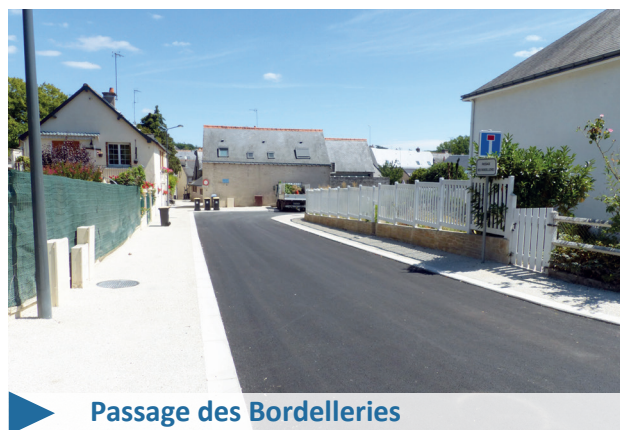
Passage des Bordelleries