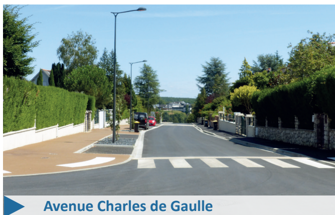
Avenue Charles de Gaulle