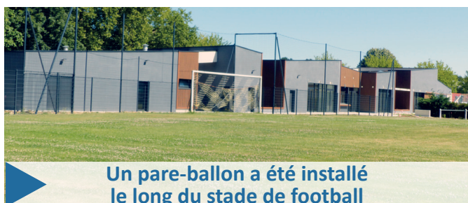
Un pare-ballon a été installé le long du stade de football