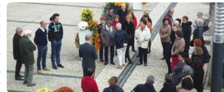
Lundi 16 Novembre à 12h, sur le parvis de l'hôtel de ville un hommage a été rendu aux victimes des attentats de Paris.

La Municipalité de la Membrolle-sur-Choisille, qui porte et défend les valeurs de la République, et plus de 200 de ses administrés, ont rendu un vibrant hommage dimanche 15 novembre à 18h aux victimes des attentats survenus vendredi 13 novembre 2015 à Paris et Saint-Denis. Elle a au travers des propos de son Maire apporté son soutien inconditionnel à tous leurs proches et aux nombreux blessés. Dénonçant ces actes qui fragmentent la société et remettent en cause nos valeurs et les Droits de l'Homme, la commune de la Membrolle-sur-Choisille apporte tout son appui aux autorités de l'État dans leur lutte contre le terrorisme.