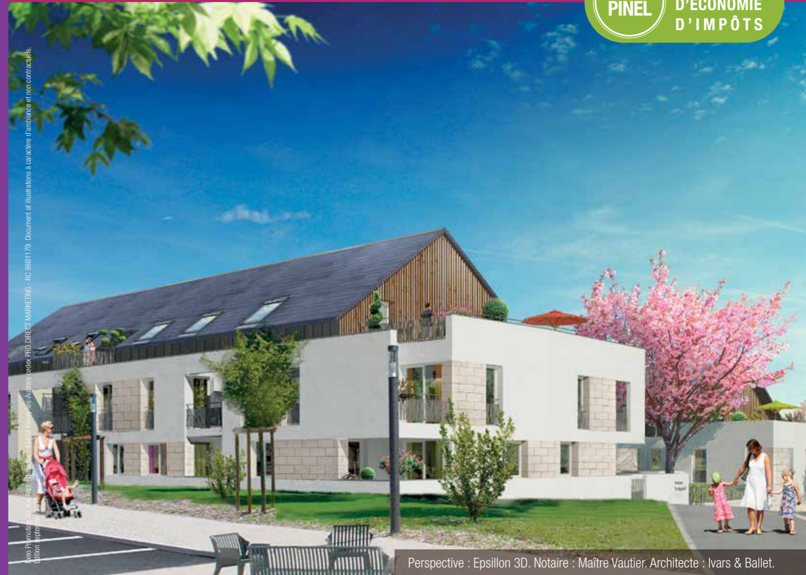
Perspective : Epsilon 3D. Notaire : Maître Vautier. Architecte : Ivars & Ballet.

DISPOSITIF PINEL JUSQU'À 21% D'ÉCONOMIE D'IMPÔTS