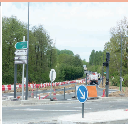
AVRIL / MAI : COULAGE D'UNE PARTIE DE L'ENROBÉ, TRACAGE DU MARQUAGE AU SOL, INSTALLATION DES FEUX TRICOLORS & DES NOUVEAUX PANNEAUX DE SIGNALISATION