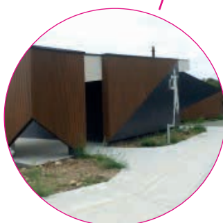
Maison des Associations