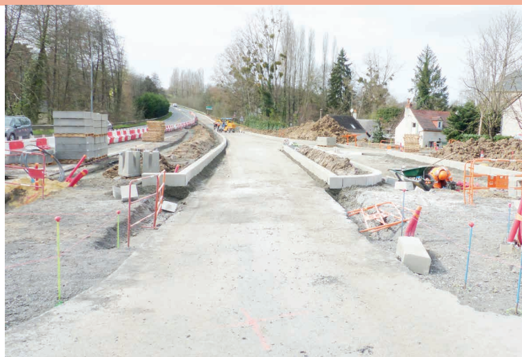
MARS : DÉFINITION DES ZONES VERTES, SORTIE DE TERRE DES PREMIERES BORDURES DE DÉLIMITATION