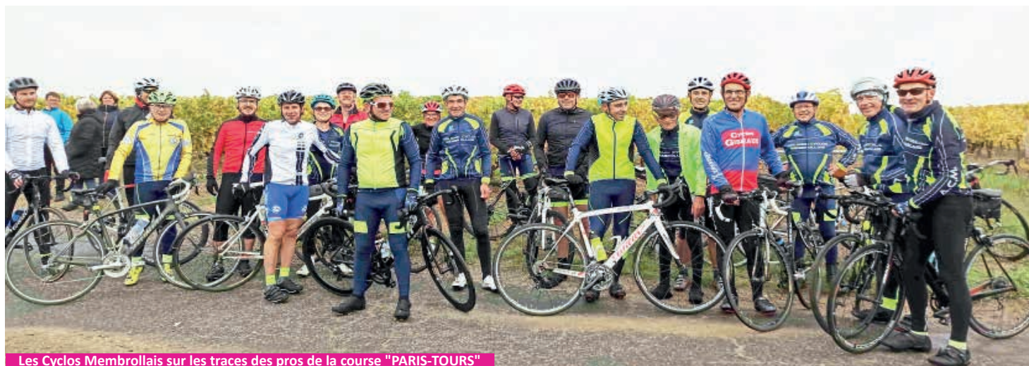
Les Cyclos Membrollais sur les traces des pros de la course "PARIS-TOURS"

Ce n'est pas le virus qui va leur retirer le plaisir de faire du vélo ! Depuis mars 2020, ils ont dû s'adapter, rouler seul ou en petits groupes...Mais depuis les dernières annonces gouvernementales, le club se prépare et les programmations de sorties reprennent !