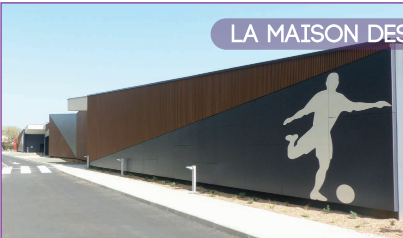
LA MAISON DES ASSOCIATIONS