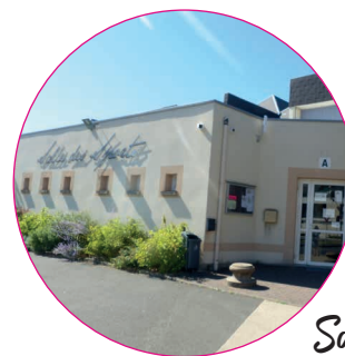
Salle des Sports