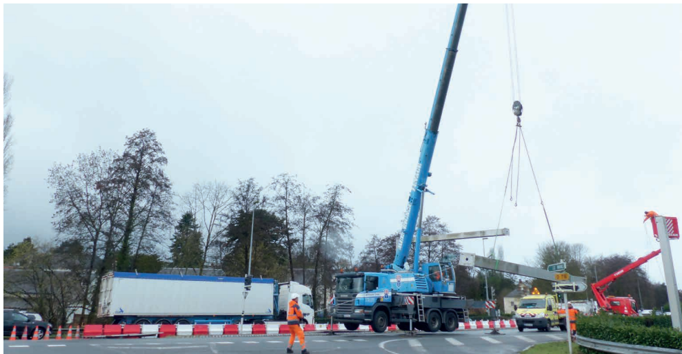
FÉVRIER : DÉMONTAGE DES PORTIQUES DIRECTIONNELS, DES GLISSIÈRES DE SÉCURITÉ ET DES ÎLOTS SÉPARATEURS.