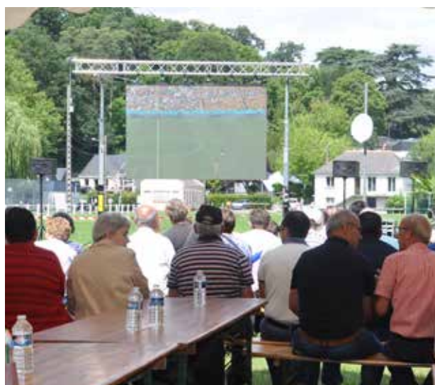
Diffusion du match France / Australie sur écran géant