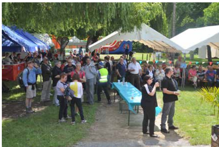
Accueil des Membrolles de France et randonnée dans La Membrolle-sur-Choisille

A l'occasion de ses 20 ans, l'association l'A.P.A.R.T vous a accueilli ainsi qu'un grand nombre d'exposants.