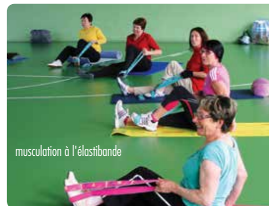
musculature à l'élastibande

Après la pause des vacances de l'été, la Gymnastique Volontaire lance sa 40 e saison. Quelques évolutions dans la pratique, mais toujours l' objectif de trouver dans le sport un mieux-être.