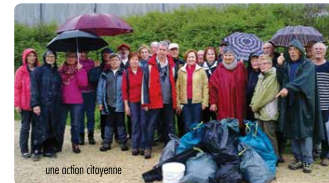
une action citoyenne

Contact : C.S.M. randonnée pédestre - Les Arquéleux 02 47 41 20 18 - pdt.arqueleux@orange.fr